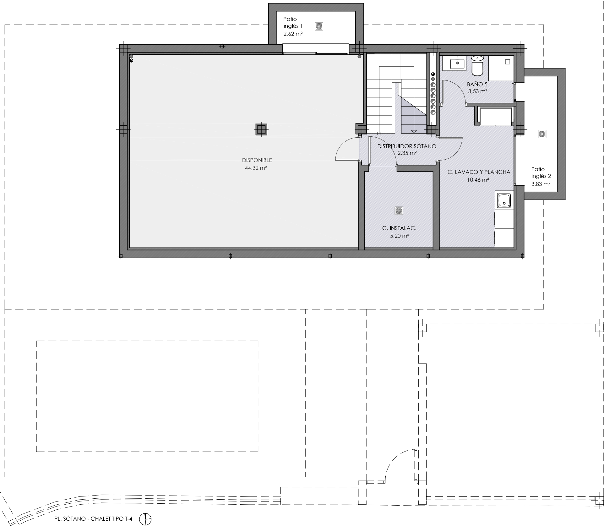
PL. SÓTANO - CHALET TIPO T-4