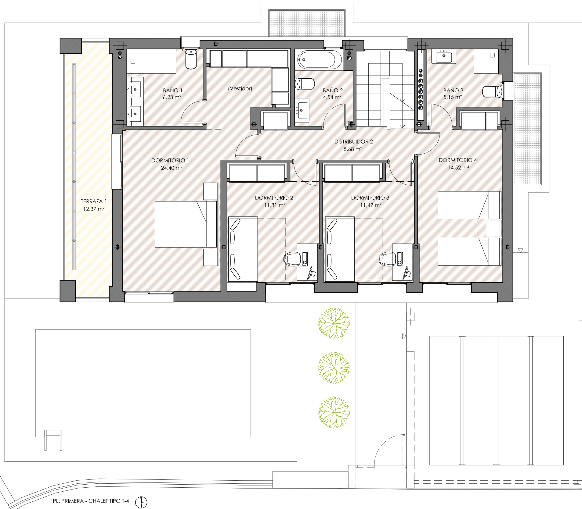
PL. PRIMERA - CHALET TIPO T-4